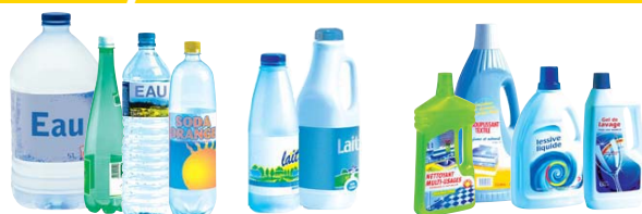
Bouteilles d'eau, de soda, de lait, de soupe - Flacons de produits ménagers