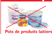
Pots de produits laitiers