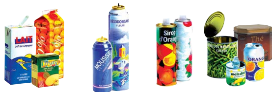
Briques alimentaires - Aérosols - Bidons - Boîtes à thé, de conserve, boîtes de boisson