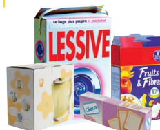
Boîtes et suremballages en carton