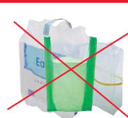
Suremballages, sacs, films en plastique